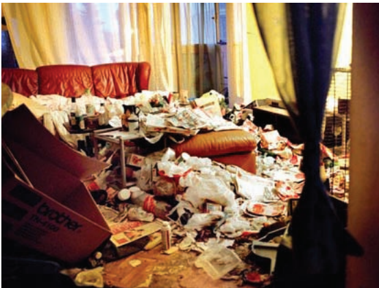
Illustration d'une accumulation d'objets caractéristique d'un syndrome de Diogène.